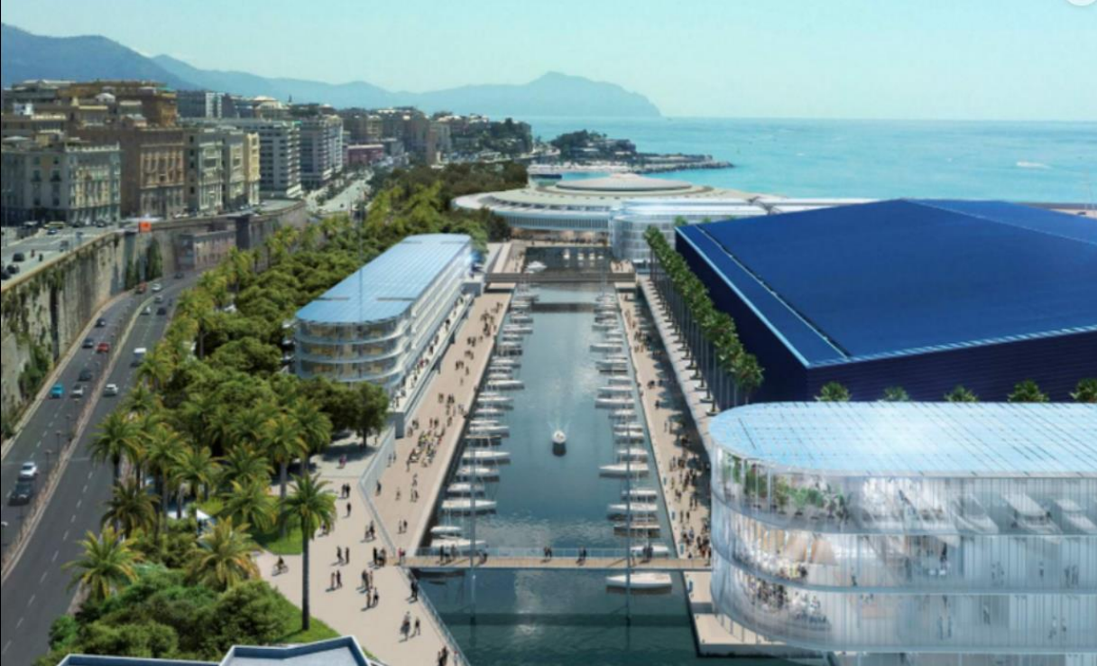
Waterfront di Levante - Genova