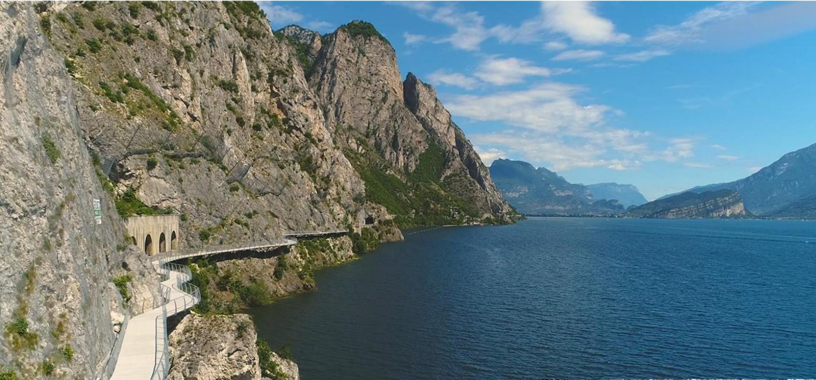
Ciclovía Lago di Garda