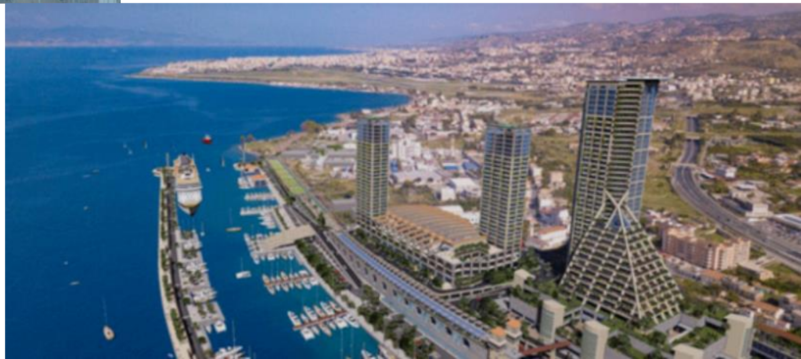
Porto Bolaro – Reggio Calabria